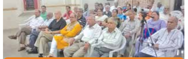
उपस्थित कुलबांधव प्रेक्षक